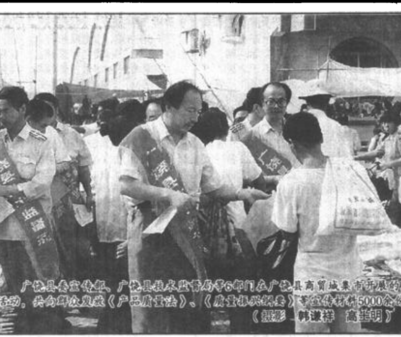
广饶县县委、县政府在广饶县县委党校为县内各界举办的“双拥”宣传月活动，共有群众参加《产品展销会》、《双拥知识竞赛》等系列活动500余场。

新的思想观念对个体私营经济的发展起了巨大的推动作用，招商引资工作迈出了新的步伐，个体私营户迅速发展。目前，刘家居委会各类商户470户，从业人员达900人，其中本居参与人员达300人，个体私营经济的迅猛发展，带动了居委会房租、饮食、运输、服务等相关行业的发展，使第三产业的内部构成进一步合理。1997年，刘家居委会个体私营经济总收入达1.5亿元，居民人均纯收入达5000元。(房金玲)